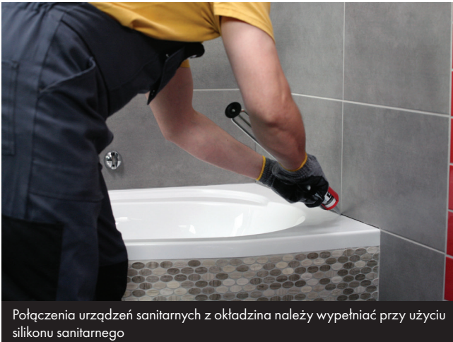
Połączenia urządzeń sanitarnych z okładzina należy wypełniać przy użyciu silikonu sanitarnego