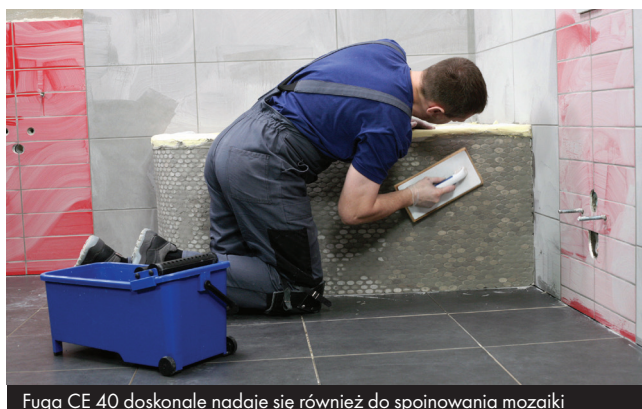
Fuga CE 40 doskonale nadaje się również do spoinowania mozaiki