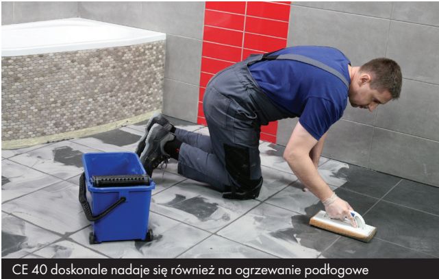
CE 40 doskonale nadaje się również na ogrzewanie podłogowe

Sypka CE 40 ma właściwości drażniące, a zawartość cementu powoduje, że po zmieszaniu z wodą zaprawa ma odczyn alkaliczny. W związku z tym należy chronić skórę i oczy. W przypadku kontaktu materiału z oczami należy przepłukać je obficie wodą i zasięgnąć porady lekarza.