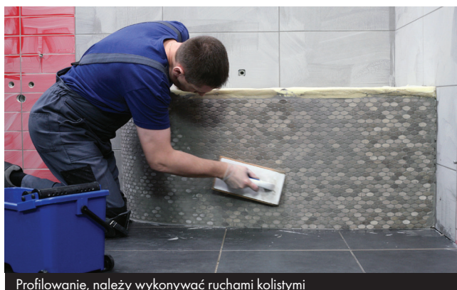
Profilowanie, należy wykonywać ruchami kołystymi

Spoina osiąga pełną hydrofobowość (odporność na wnikanie wody) po 5 dniach od aplikacji.