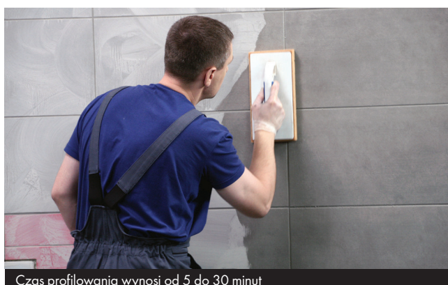
Czas profilowania wynosi od 5 do 30 minut