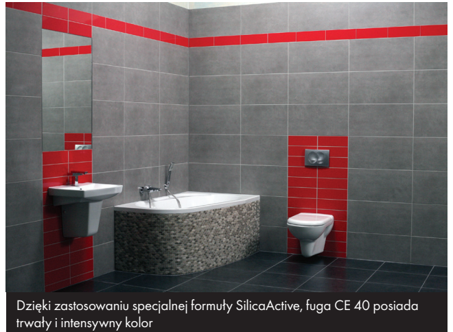
Dzięki zastosowaniu specjalnej formuły SilicaActive, fuga CE 40 posiada trwałą i intensywny kolor