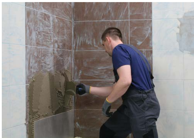
Doskonale nadaje się do klejenia płytek na istniejącej okładzinie ceramicznej

Istniejące zabrudzenia, warstwy zwierzające i powłoki malarskie o niskiej wytrzymałości należy usunąć mechanicznie. Podłoża nasiąkliwe zagruntować preparatem Ceresit CT 17 i odczekać do wyschnięcia co najmniej 2 godziny. Nierówności podłoża do 5 mm mogą być dzień wcześniej wypełnione zaprawą CM 16. W przypadku większych nierówności i ubytków – na posadzkach należy zastosować materiały Ceresit z grupy CN, a na ścianach szpachlówkę Ceresit CT 29.