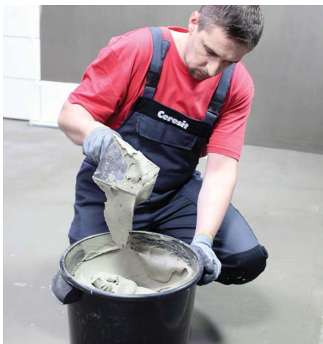
Zaprawa CM 16 w bardzo łatwy sposób rozrabia się i jest w 100% homogeniczna

Zawartość opakowania wysypywać do dokładnie odmierzonej ilości czystej, chłodnej wody i mieszać za pomocą wiertarki z mieszadłem, aż do uzyskania jednorodnej masy. Odczekać 5 min i jeszcze raz wymieszać. Jeśli potrzeba – dodać niewielką ilość wody i zamieszać ponownie.