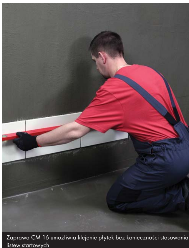
Zaprawa CM 16 umożliwia klejenie płytek bez konieczności stosowania listew startowych

Płytek nie moczyć w wodzie! Układać je na zaprawie i dociskać póki jeszcze zaprawa lepi się do rąk. Nie układać płytek na styk! Zachować szerokość spoin w zależności od wielkości płytek i warunków eksploatacji. Świeże zabrudzenia zaprawą zmywać wodą, a stwardniałe usuwać mechanicznie. Spoinować nie wcześniej niż po 24 godzinach używając spoin Ceresit z grupy CE.