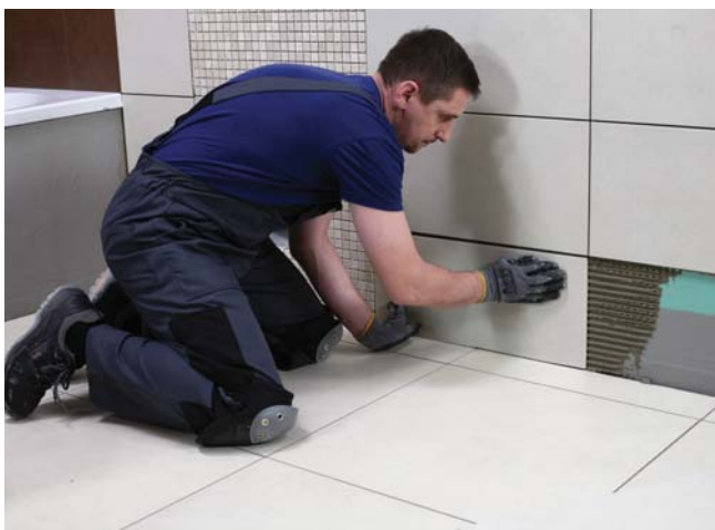
Zaprawa CM 16 zalecana jest do klejenia małych jak i dużych płytek ceramicznych, wewnątrz jak i na zewnątrz pomieszczeń

Dylatacje między płytkami, spoiny w narożach ścian, w połączeniach ścian z posadzką i przy urządzeniach sanitarnych należy wypełnić silikonem Ceresit CS 25 MicroProtect.