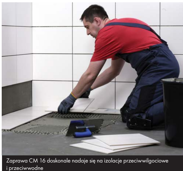
Zaprawa CM 16 doskonale nadaje się na izolację przeciwwilgociową i przeciwwodną

Zaprawę rozprowadzać po podłożu pacą zębatą. Wielkość zębów pacy zależy od wielkości płytek. Prawdopodobnie dobrana konsystencja i wielkość zębów pacy sprawiają, że dociśnięta, typowa płytka ceramiczna nie spływa z płaszczyzny pionowej, a zaprawa pokrywa min. 65% powierzchni montażowej płytki. W przypadku zakurzenia, zabrudzenia spodniej części płytek, należy dokładnie oczyścić przed przystąpieniem do ich klejenia. Przy aplikacji CM 16 na zewnątrz budynków – należy stosować metodę kombinowaną, tzn. poza rozprowadzeniem kleju po podłożu przy pomocy pacy zębatej, należy gładkim narzędziem nałożyć ciekłą warstwę zaprawy na powierzchni montażowej płytek.