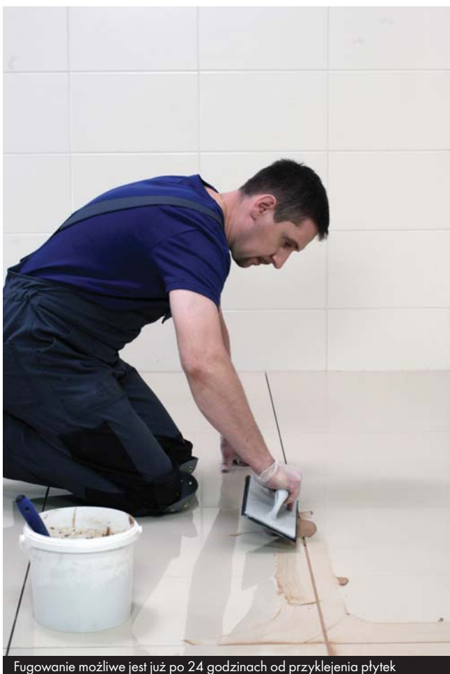
Fugowanie możliwe jest już po 24 godzinach od przyklejenia płytek

Dylatacje między płytkami, spoiny w narożach ścian, w połączeniach ścian z posadzką i przy urządzeniach sanitarnych należy wypełnić silikonem Ceresit CS 25 MicroProtect.